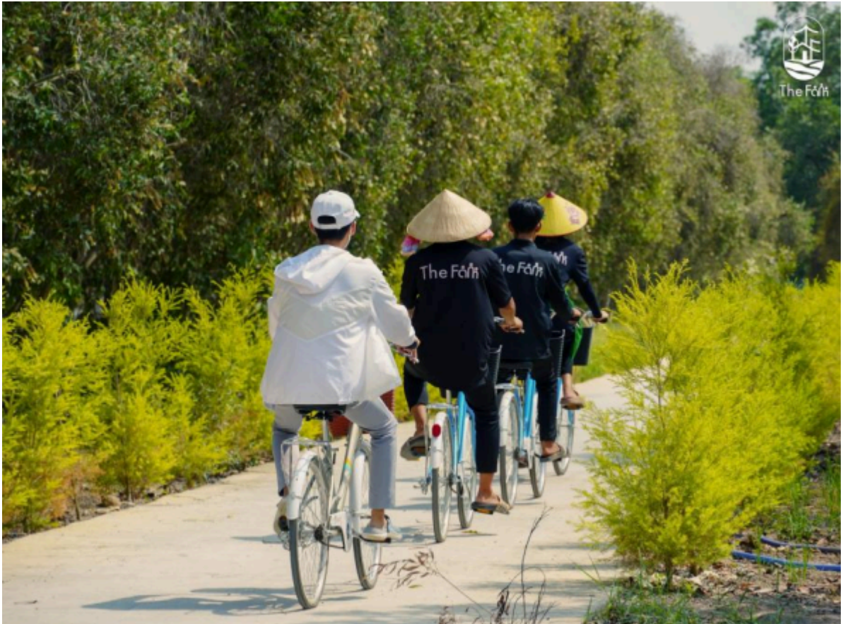
Khu vui chơi giải trí dành cho trẻ em...